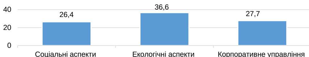
Рис. 2. Середній рівень розкриття інформації вітчизняними компаніями за показниками міжнародного індексу ESG у 2020 році, %