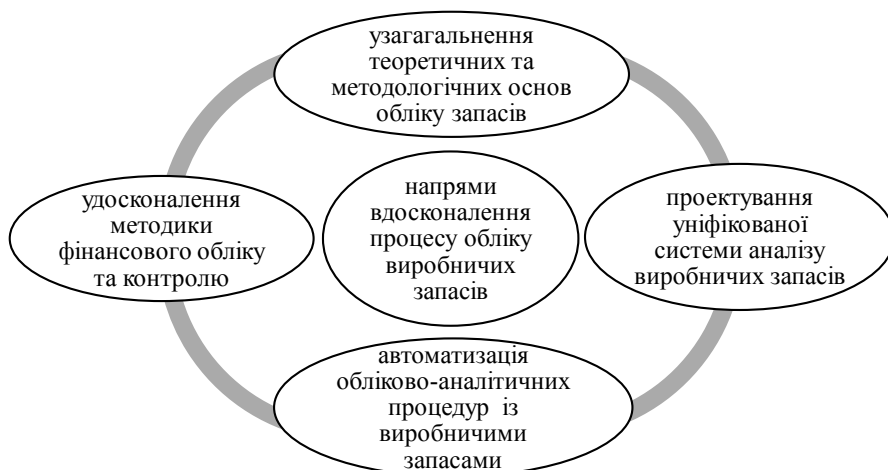
Рис. 2. Структурна схема напрямів удосконалення системи обліку виробничих запасів

залишаються безперервно наявність та ефективно використання матеріальних ресурсів. Але протягом довгого часу, незважаючи на велику кількість наукових досліджень, залишаються відкритими проблеми вдосконалення документообігу, оперативності аналітичного та синтетичного обліку та контролю матеріальних цінностей підприємства. Вирішенням цих питань стане розроблення основних напрямів та рекомендацій до поліпшення методик обліку виробничих запасів на підприємствах. Напрями вирішення проблеми обліку на підприємствах наведено на рис. 2.