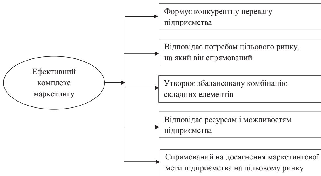
Рис. 3. Вимоги до розроблення ефективного комплексу маркетингу підприємства

Джерело: побудовано автором на основі опрацювання наукових джерел [9; 10]