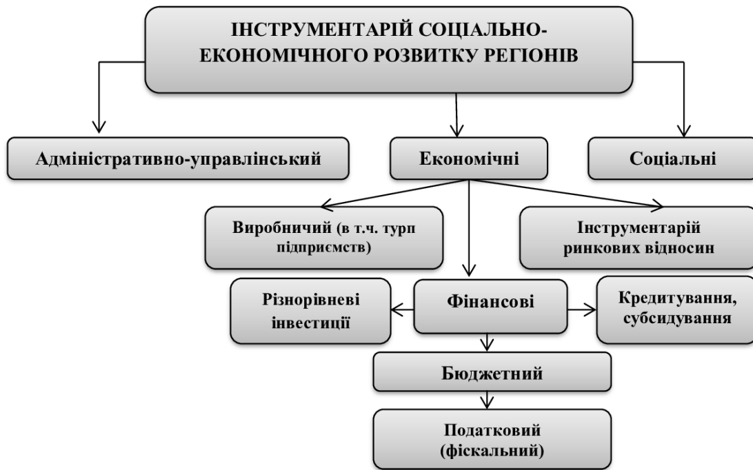
Рис. 1. Схема інвестиційного інструментарію соціально-економічного розвитку регіонів

думови для подальшої реалізації програми з розвитку інклюзивного середовища в Україні. Тому доцільним було розглянути ті відмінності ресурсно-рекреаційного потенціалу території України, які можна в перспективі використати для потреб інклюзивного туризму [6].