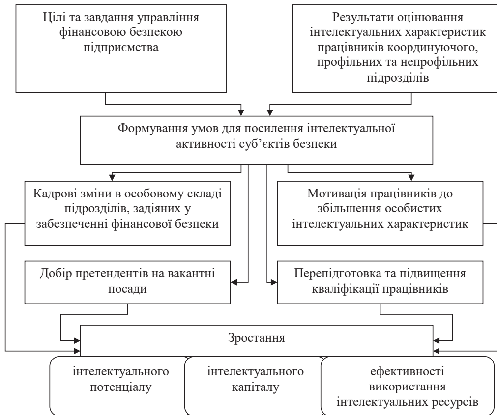
Рис. 2. Процес розвитку інтелектуалізації управління фінансовою безпекою підприємства

Результати оцінювання інтелектуальних характеристик кожного працівника мають стати основою для вдосконалення організаційного забезпечення та внесення потрібних змін у кадрову політику у сфері фінансової безпеки підприємства шляхом: