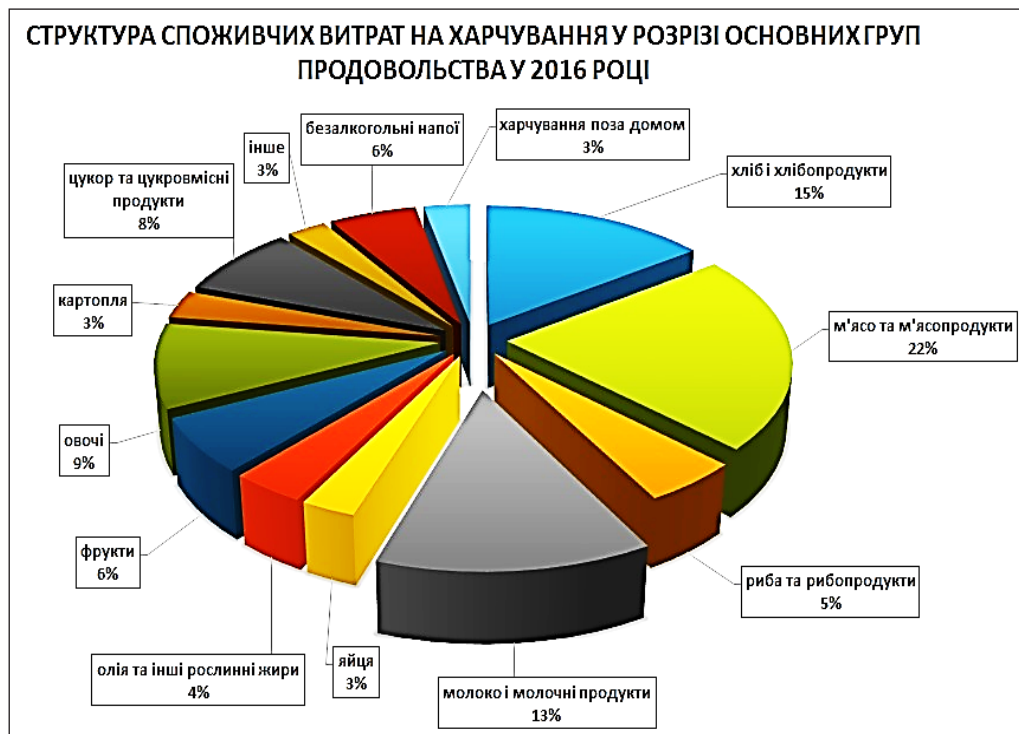
Рис. 2. Структура споживчих витрат на харчування (%)

Аграрні холдинги зацікавлені у виробництві значних обсягів товарного зерна та олійних культур, на які є постійний попит на світових ринках.