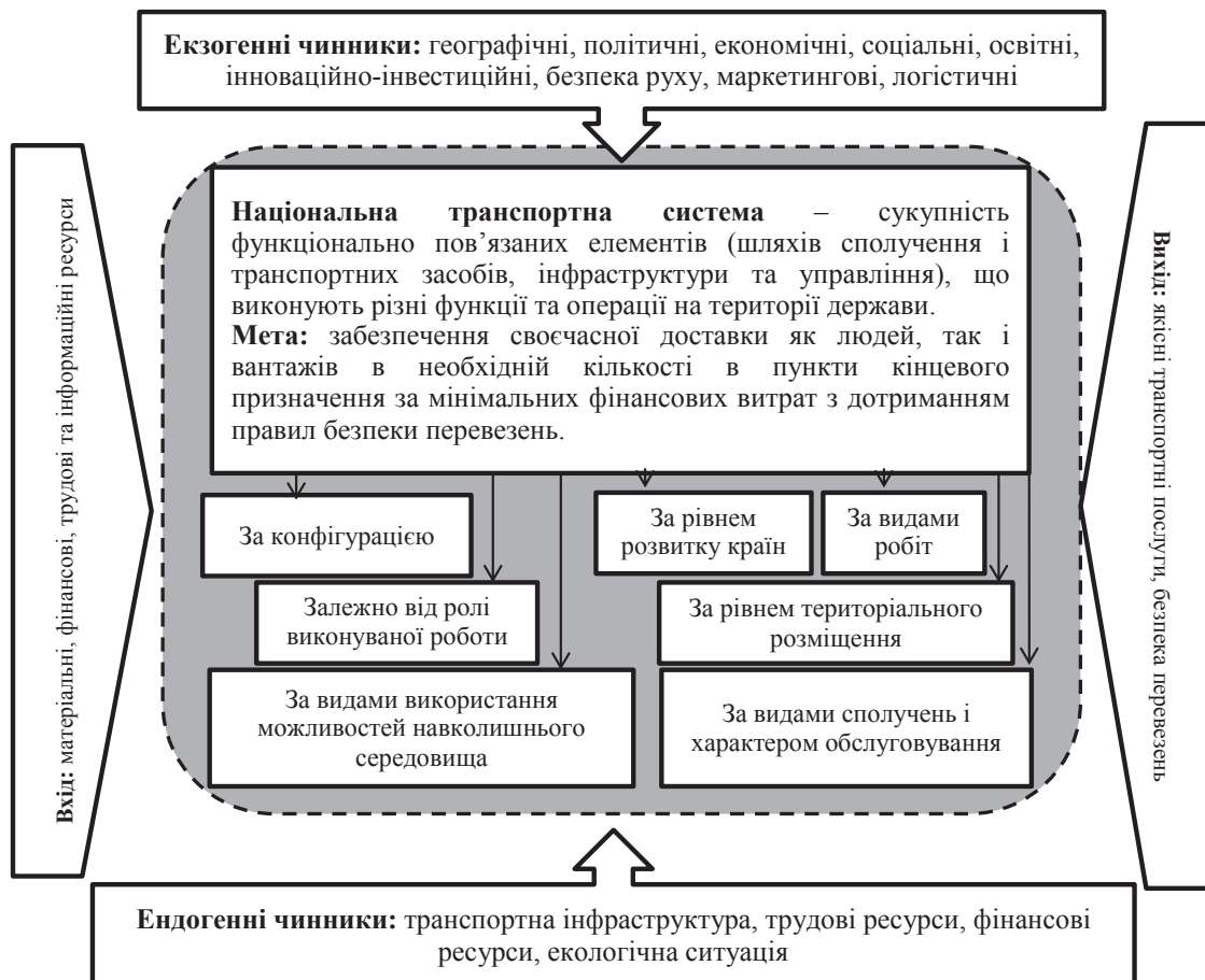
Рис. 1. Екзогенні та ендогенні чинники функціонування національної транспортної системи

Метою дослідження є визначення результативності функціонування національної транспортної системи на основі комплексного ситуаційного аналізу масиву статистичних даних