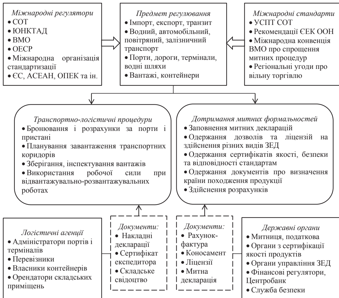
Рис. 2. Принципи забезпечення роботи повнофункціонального «єдиного вікна» у сфері зовнішньоекономічної діяльності

Новітнім інструментом в системі міжнародного торгового права, який визначає вимоги до практики запровадження «єдиного вікна» та критерії оцінки його ефективності, є Угода СОТ про спрощення процедур торгівлі, підписана за результатами ІХ Міністерської конференції СОТ, у грудні 2013 р. Відповідно до пункту 4 Статті 10 Угоди «Формальності, пов'язані з імпортуванням, експортуванням і транзитом» члени СОТ мають «прагнути створити, або підтримувати наявну систему «єдиного вікна», що дозволяє учасникам ЗЕД надавати відповідним органам, або відомствам, документацію та/або необхідні дані для ввезення, вивезення, або транзиту, товарів через єдиний перепускний канал». Крім того, вони «повинні повідомити заснований Угодою Комітет зі спрощення процедур торгівлі про деталі роботи «єдиного вікна», і, в міру можливості,