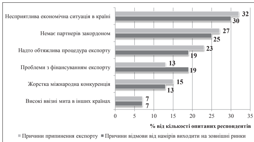
Рис. 1. Головні причини припинення експорту та відмови виходити на зовнішні ринки для українського бізнесу