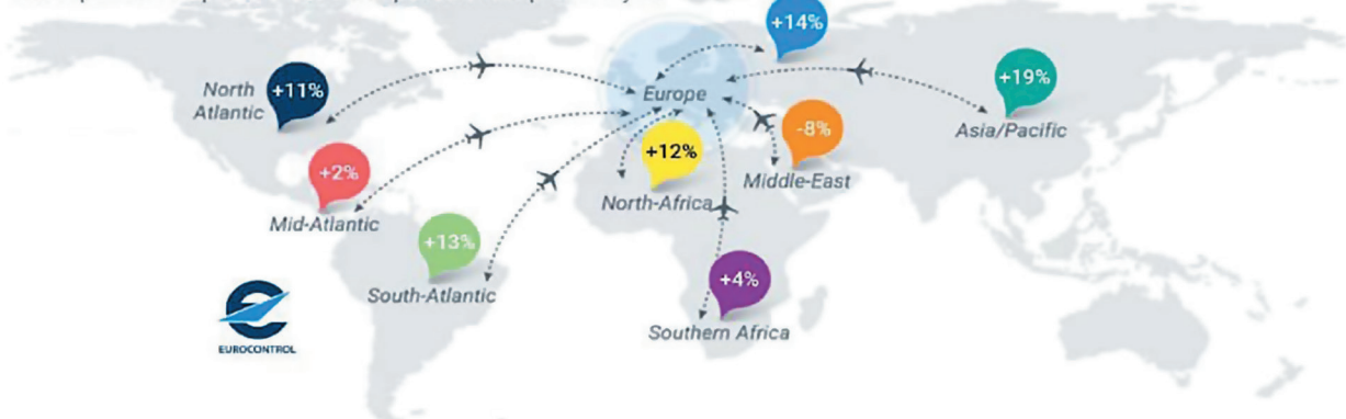
Рис. 2. Темпи зростання кількості польотів в 2024 р.

Jun-Sep 2024 compared to the same period of the previous year