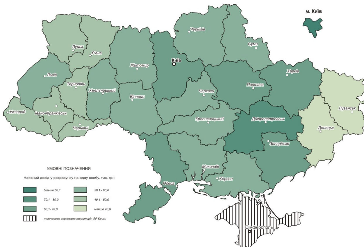
Рис. 2. Наявний дохід у розрахунку на одну особу в Україні у 2018 р., тис. грн.