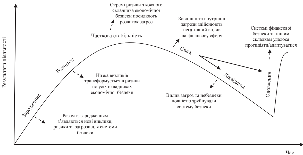
Рис. 2. Процес інтенсифікації загроз протягом життєвого циклу підприємства

На нашу думку, саме момент, коли зовнішні і внутрішні загрози починають суттєво впливати на фінансову сферу, можна говорити про стадію спаду підприємства за всіма складниками економічної безпеки. Процес інтенсифікації загроз може займати тривалий період часу і без