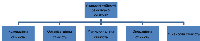
Рисунок 2. Складові стійкості банківської установи

Досвід процвітаючих в умовах ринку банків переконує в тому, що їхній стійкий розвиток залежить від сукупності таких властивостей, як гнучкість і швидкість реакції на зміни кон’юнктури ринку, конкурентоспроможність продуктів та банку в цілому, інвестиційна активність, висока ліквідність і фінансова стабільність, широке використання інноваційних факторів для саморозвитку. Стійкість комерційного банку залежить від багатьох аспектів його діяльності і має складну структуру. На думку науковців Е. Дж. Долан [10], Р. Л. Міллер [11], П. С. Роуз [10], Дж. Ф. Сінкі [9], Дж. К. Ван Хорн [11], слід виділяти такі складові стійкості банківської установи (рис.2).