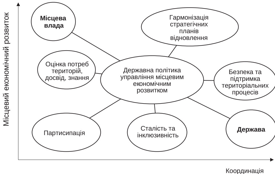
Рис. 2. Диверсифікація державної політики управління місцевим економічним розвитком

3. В стратегіях розвитку територіальних громад; перегляд місії, стратегічного бачення, ключових цілей. Стратегії відновлення, як правило, зосереджуватимуться на фізичній інфраструк-