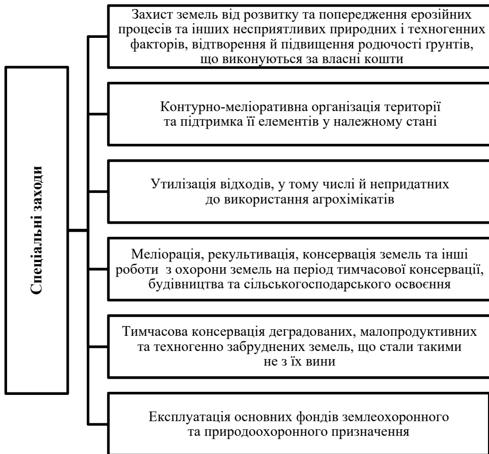
Рис. 1. Заходи та впровадження, що обґрунтовують предмет економічного стимулювання

внаслідок негативного впливу, спричиненого діяльністю громадян, юридичних осіб, органів місцевого самоврядування або держави [1].