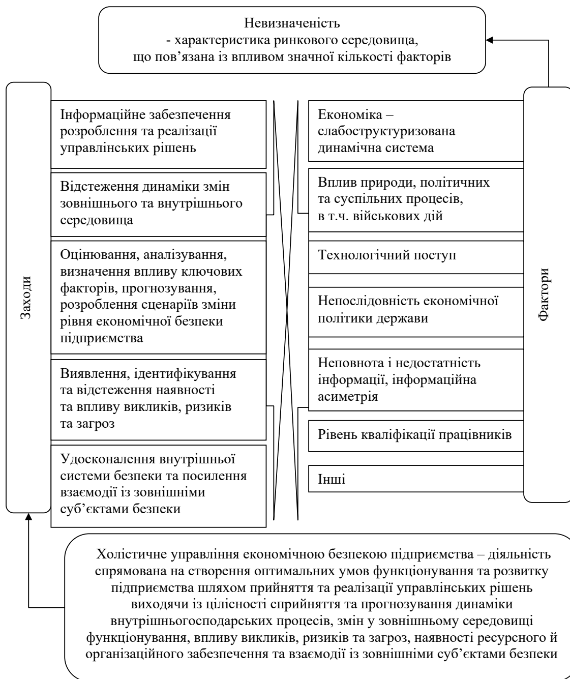
Рис. 1. Параметри невизначеності, які доцільно враховувати в процесі формування системи холистичного управління економічною безпекою підприємства