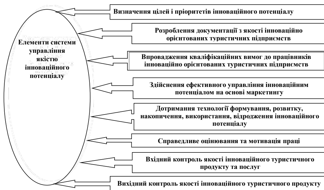
Рис. 1. Елементи системи управління якістю інноваційного потенціалу