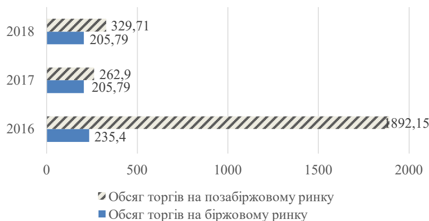
Рис. 2. Обсяг торгів на ринку цінних паперів у 2016–2018 рр., млрд. грн