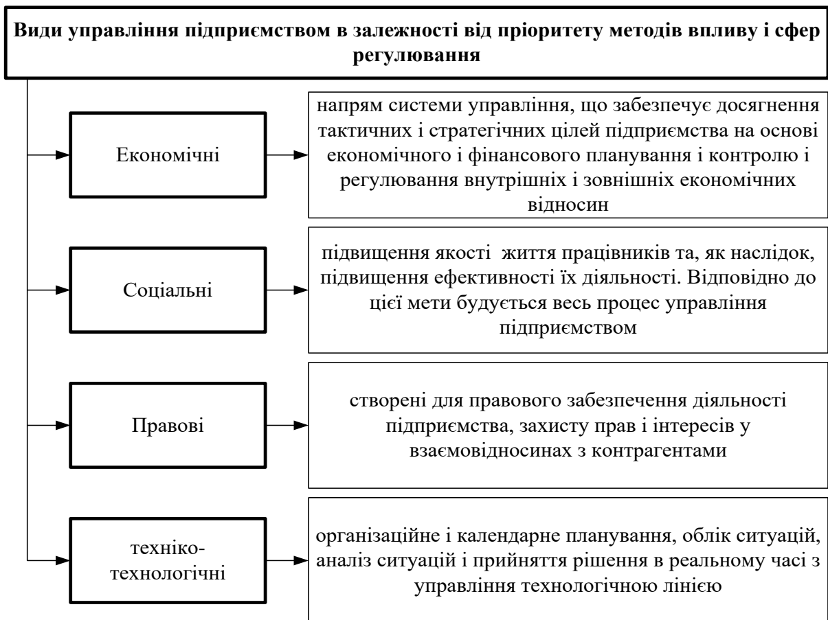
Рис. 3. Види управління підприємством в залежності від пріоритету методів впливу і сфер регулювання

– адаптивною (здатною адаптуватися до змін зовнішнього середовища);