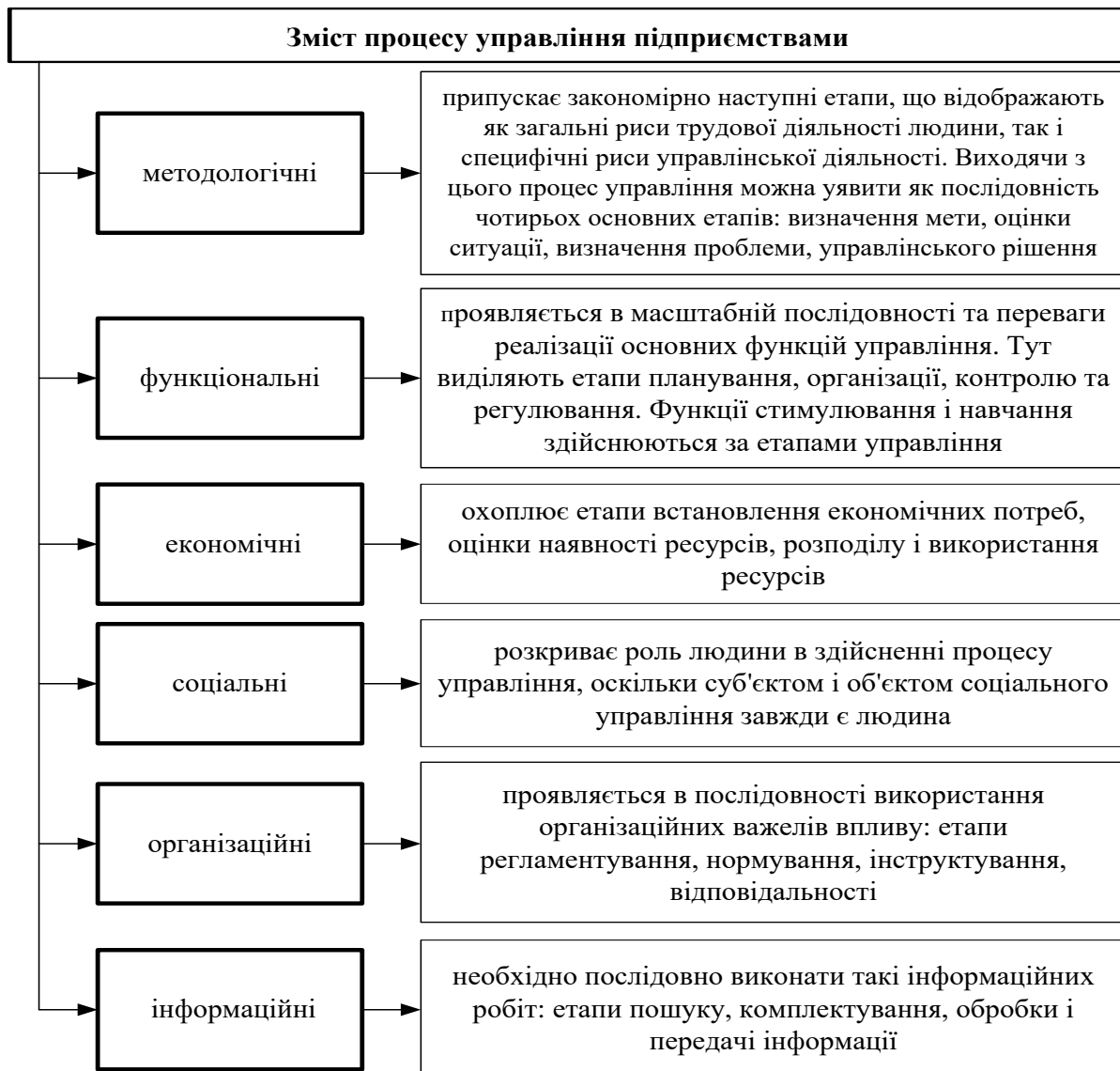
Рис. 4. Зміст процесу управління підприємствами

– гнучкою, динамічною (здатною миттєво реагувати на зміну попиту, вдосконалення технології виробництва, поява інновацій);